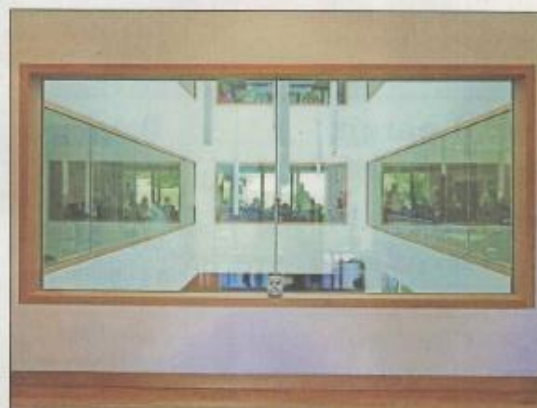
Détail de l'intérieur du bâtiment, dont la construction a commencé en 2018.

Mais en 2014, gros coup de frein: le Conseil communal de Penthaz refuse le crédit d'études. La Commune doit donc se retirer. Fallait-il abandonner le projet dans lequel un demi-million de francs avait déjà été investi? Le Conseil de Fondation de l'EMS a préféré poursuivre en demandant au bureau d'architectes de présenter une seconde mouture. Et ce n'est qu'au début de l'année 2018 que les premières machines de chantier sont arrivées sur le site.